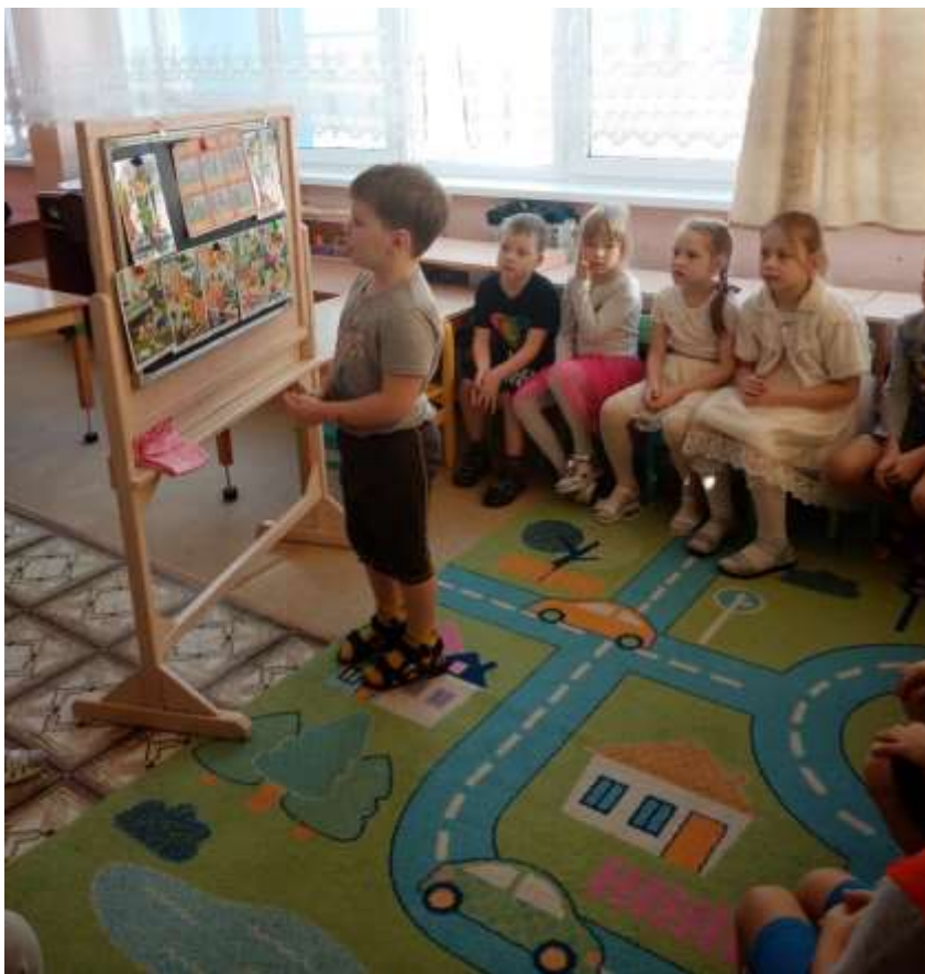
Сюжетно-ролевая игра «Пожарные»