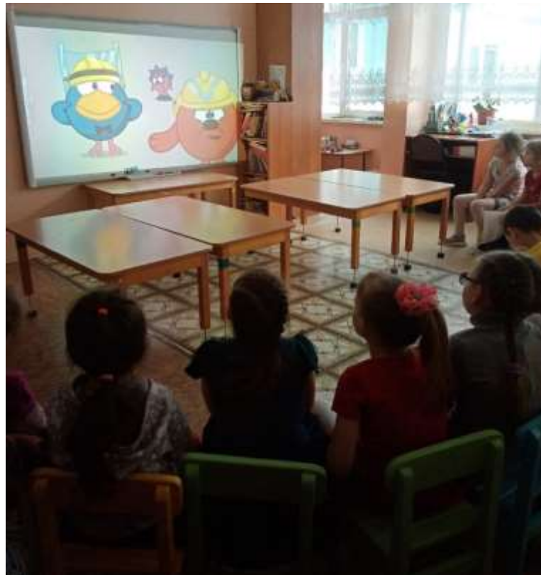
Беседы «Огонь-друг, огонь враг», «Огонь бывает разным», «Правила пожарной безопасности»